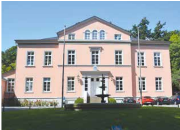
Kreis Birkenfeld vertraut auf die Lösung Care4.

der für Birkenfeld relevante Bereich mehr und mehr veraltete. Dadurch wurden die Prozesse immer stärker und fehlerbehafteter, andere Funktionen fielen weg oder fehlten ganz. Auch beim Thema Service wünschte man sich in Birkenfeld eine bessere Betreuung.